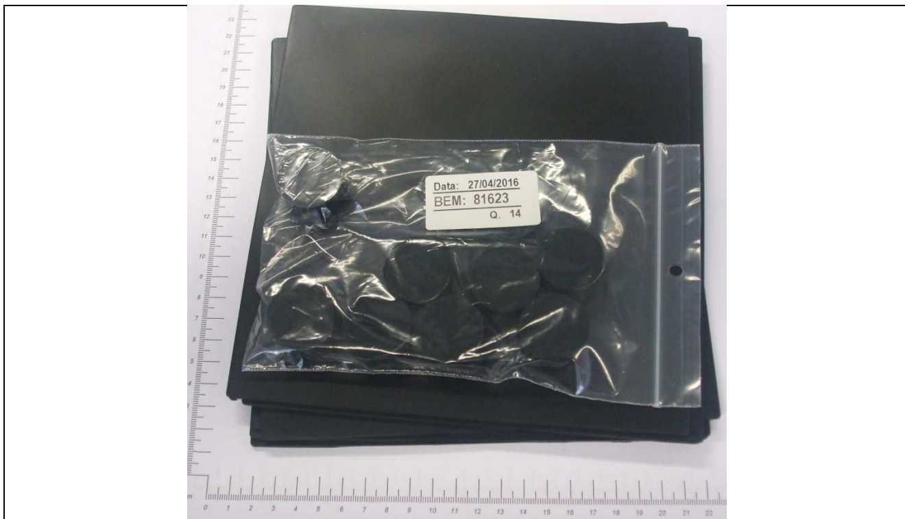
Foto prima della prova / Photo before test